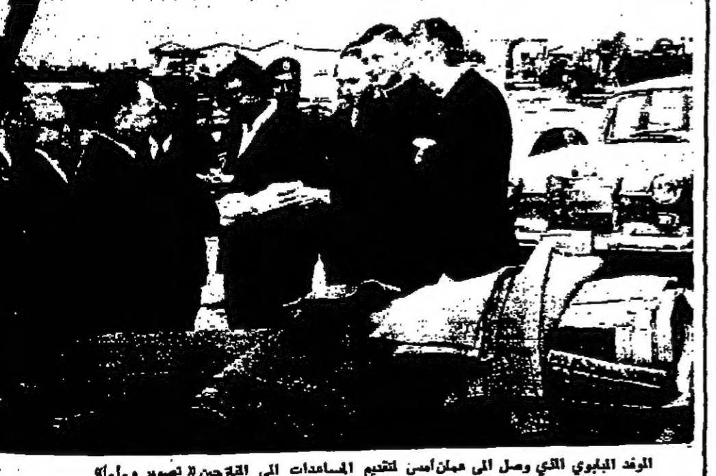
الوفد اليابوي الذي وصل الى عمان امس لتقييم المساعدات التي اقترحت في